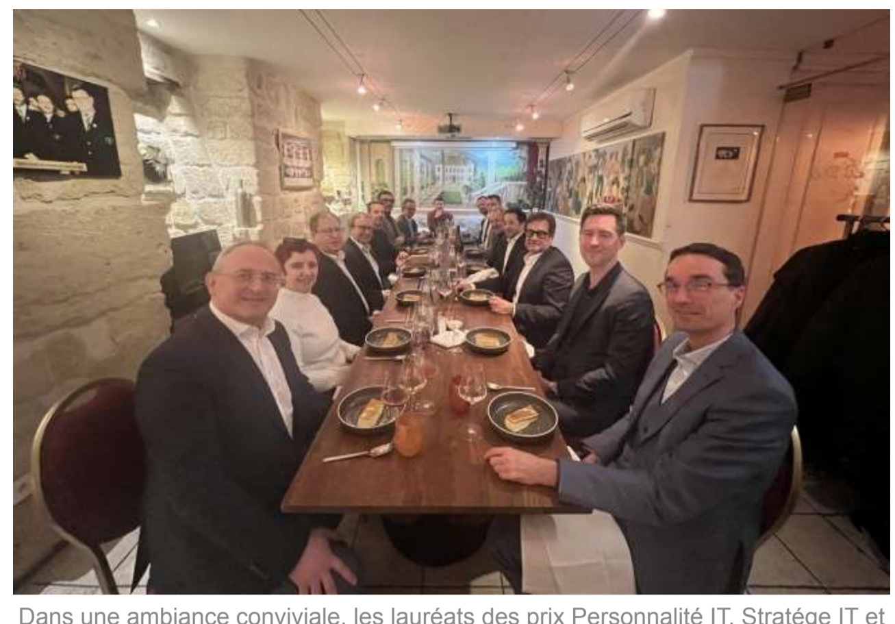
Dans une ambiance conviviale, les lauréats des prix Personnalité IT, Stratège IT et Innovation 2023 du Monde Informatique et CIO ont répondu présents.

A l'occasion d'une soirée conviviale, les rédactions de LMI et de CIO ont remis les prix aux lauréats de la Personnalité IT et du Stratège IT 2023. Un prix innovation a aussi récompensé une start-up.