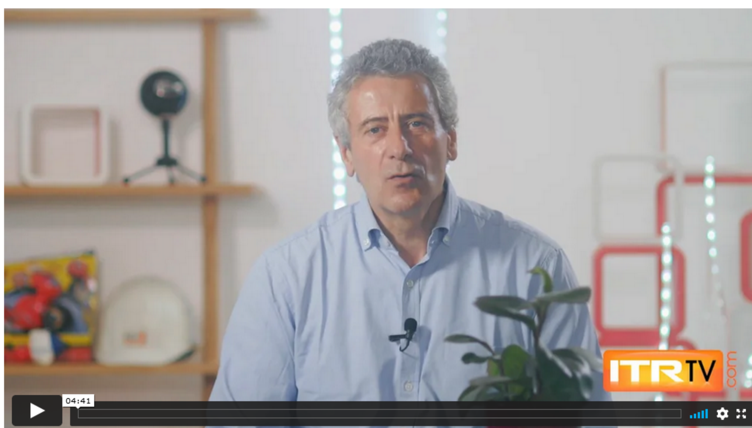
Les milliardaires millénial, 5ème hebdo de juin 2021