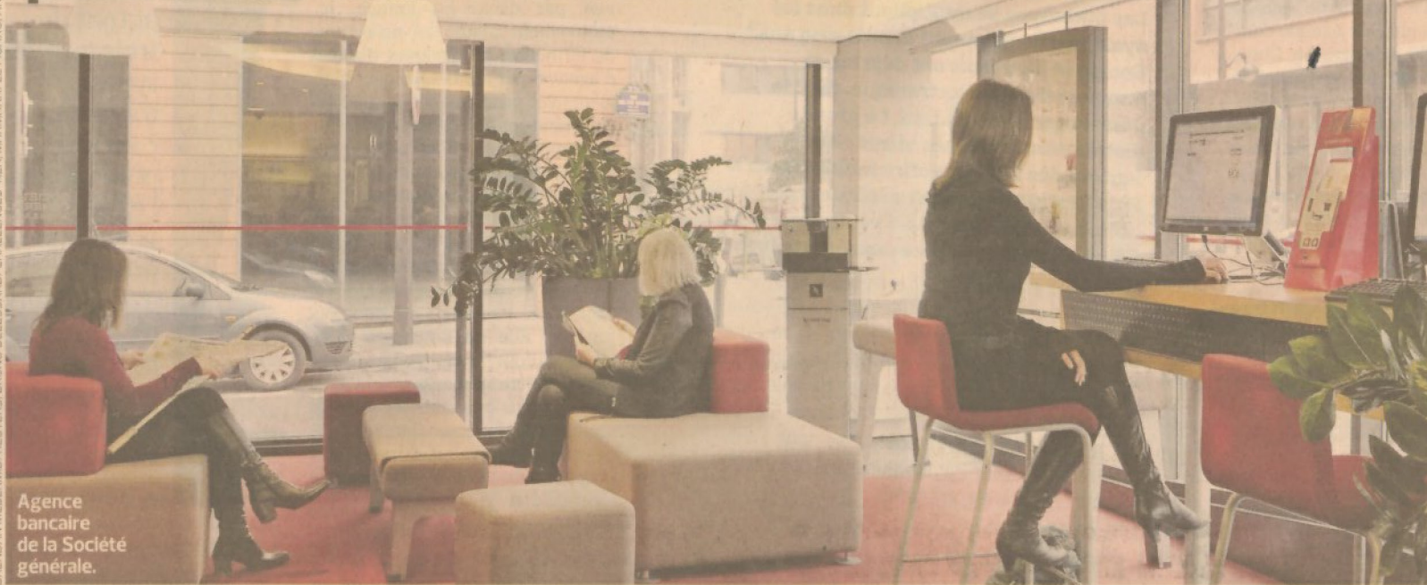
Agence bancaire de la Société générale.

Le passage à l'ère du numérique est devenu une priorité pour les établissements qui multiplient les services en ligne pour coller aux attentes de leurs clients. PAGE 24