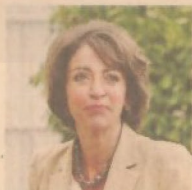
Marisol Touraine veut sanctionner les établissements qui ne respectent pas le repos de sécurité.

SANTÉ Les internes font grève ce lundi pour demander le respect des repos de sécurité, à l'appel de l'inter-syndicat national des internes (Isni). Obligatoire depuis 2002, le repos de sécurité est une pause de 11 heures qu'un interne en médecine doit prendre à l'issue de chaque garde de nuit, pour éviter qu'il ne travaille 24 heures d'affilée. Malgré les instructions données par la ministre