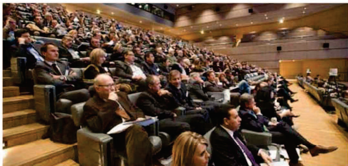
Légende : près de 900 participants ont répondu présents à l'appel du 3 Sommet économique du Grand Sud.

De l'avis général, la collaboration reste très utile pour la prospection de marchés à l'étranger, mais ne remet pas en cause les fondamentaux de la très libérale concurrence. Les discussions ont également tourné autour de thématiques, comme celle de la culture d'entreprise, de l'ambition des dirigeants à grandir, des méthodes de financements (notamment publics) des entreprises, et autres conditions favorables à la croissance des entreprises. « Ce qu'il faut parvenir à mettre en place c'est de la "coopétion", autrement dit, ne pas opposer concurrence et coopération l'objectif étant de mutualiser des moyens financiers au service de la croissance, mais également de développer un projet de société incluant réellement tous les acteurs et individus de la vie économique », indique Karim Messeghem.