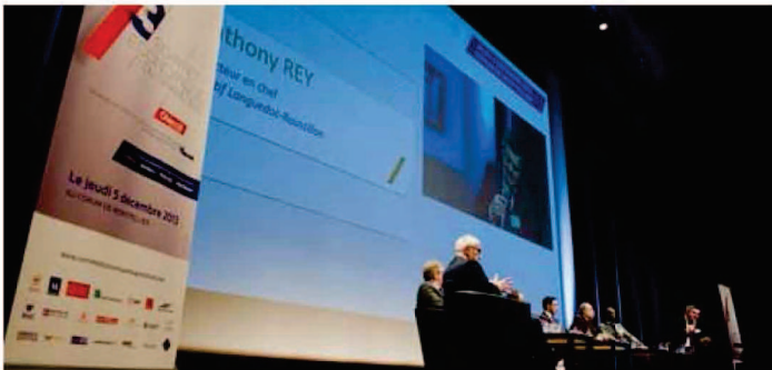
Légende : Les huit débatteurs de la 1 ère table ronde, dédiée à la compétitivité.