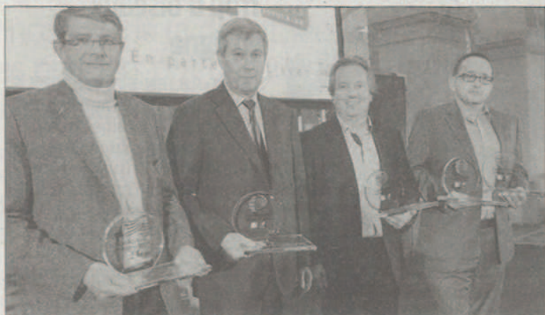
Les quatre sociétés girondines lauréates.

RÉCOMPENSE Quatre sociétés distinguées hier soir dont deux obtiennent aussi un prix régional