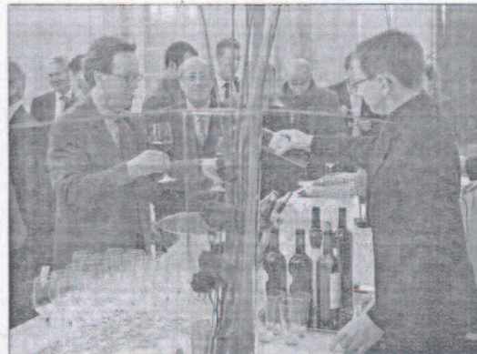
Un buffet a suivi la remise des prix à la CCI de Bordeaux.